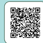
臺灣地區與大陸地區 人民關係條例