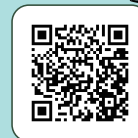
教育部 赴陸教育交流動態 登錄平臺