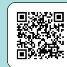
大陸委員會 國人赴陸港澳 動態登陸