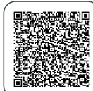
兩岸體育交流 相關規定及注意事項

依「臺灣地區與大陸地區人民關係條例」（體育團體及學校請特別注意第33條、第33-1條及第33-3條）及「兩岸體育交流處理規範」相關規定。