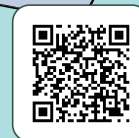
兩岸體育 交流處理規範